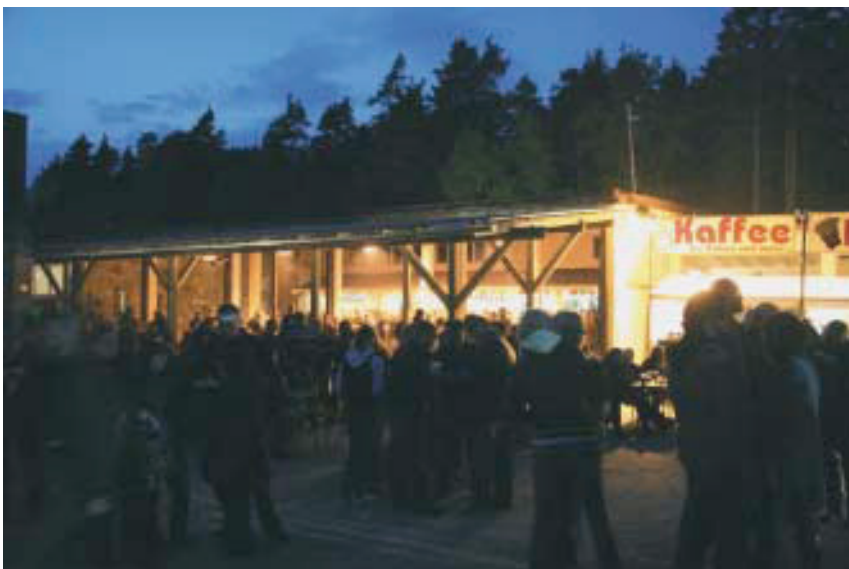
Nächtliches Treiben auf dem Platz

Kleines Resümee: Als Frau in der Nachtschicht der Einlasskontrolle befürchtete ich, dass dies ganz schön hart werden würde. Ich habe angetrunkene und aggressive Leute befürchtet, Auseinandersetzungen und natürlich die Kälte. Dadurch, dass wir so viele am Einlass waren (Bad Seven MC, der Sicherheitsdienst und wir) und die Leute selbst im angetrunkenen Zustand friedlich waren, war dies überhaupt kein Thema. Die Tonne mit Feuer vertreibt die Kälte. Es ist also machbar ... auch „für Mädchen“! ?