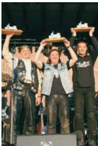
So sehen Sieger aus

aus dem Gesicht bekommen! Die Landschaft ein Traum, der Straßenzustand einwandfrei, und das Beste: ich habe die Welt für mich alleine, da alle in Hildburghausen versammelt sind! Ich bin den Rennsteig und die nähere Umgebung abgefahren, habe die schieferverkleideten Häuser bestaunt, mir Thüringer Bratwürste frisch vom Grill gegönnt und mich irgendwann für eine halbe Stunde in eine dieser riesigen Wiesen mitten in das gelbe Blütenmeer gelegt.