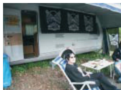
BU-Büro on tour