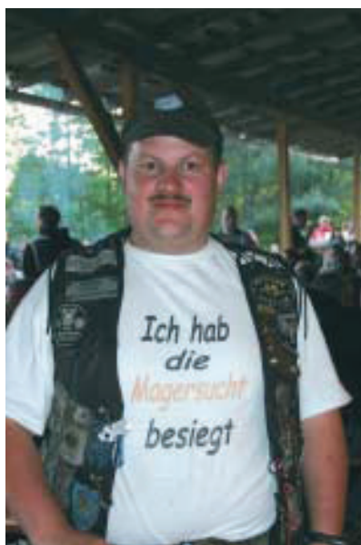
Ein Bild sagt mehr als tausend Worte

Als ich am Nachmittag wieder in Hildburghausen ankomme, sprudelte ich meine Begeisterung nur so raus, blockiere dabei die Toreinfahrt und