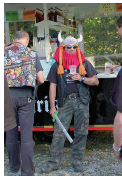
Hägars Namenstaufe trug zur allgemeinen Belustigung bei